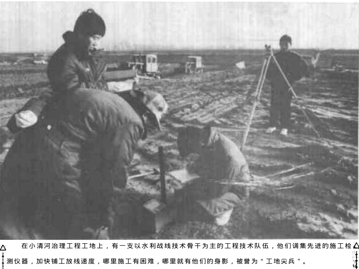
△ 在小清河治理工程工地上，有一支以水利战线技术骨干为主的工程技术队伍，他们调集先进的施工检测仪器，加快铺放线速度，哪里施工有困难，哪里就有他们的身影，被誉为“工地尖兵”。