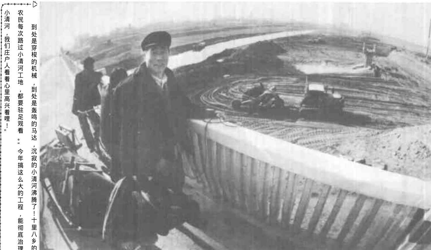
到处是穿梭的机械，到处是轰鸣的马达，沉寂的小清河沸腾了！十里八乡的农民，每次路过小清河工地，都要驻足观看。今年搞这么大的工程，能彻底治理小清河，我们庄户人看着心里高兴哩！